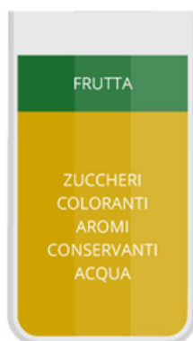
Bevande alla frutta